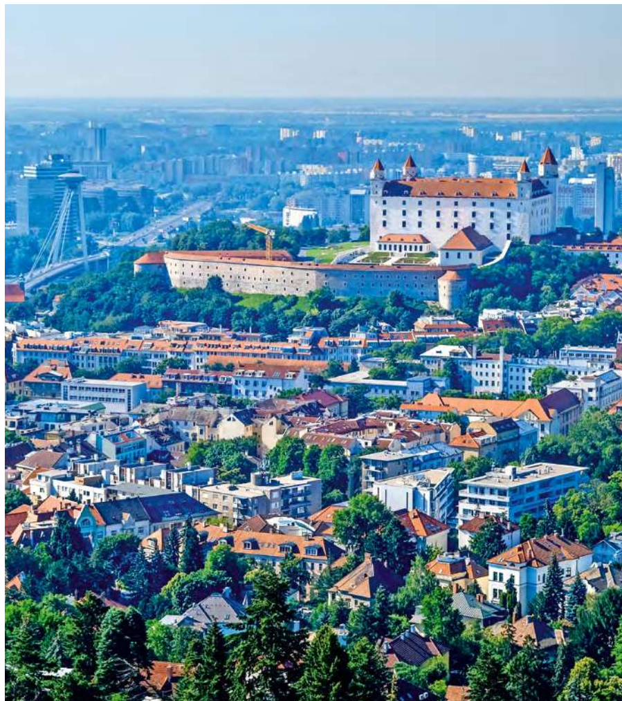
Blick auf das Stadtzentrum mit Ufobrücke und Burg Bratislava, hinter den Plattenbauten von Bratislava-Petržalka beginnt Österreich.

Die Herausforderungen, mit denen sich diese Stadtregion auseinandersetzen muss, sind vielfältig und können nur mithilfe einer grenzüberschreitenden Herangehensweise gelöst werden. Die hierfür notwendige verstärkte Abstimmung und Steuerung wird durch das Team von baum_cityregion sichergestellt. Der bisherige Fokus dieser Stadt-Umland-Kooperation lag in der Intensivierung der Zusammenarbeit der grenznahen Gemeinden und Stadtteile, der relevanten Fachabteilungen (z. B. Raumentwicklung, Verkehr, Kultur) der Bundesländer Niederösterreich und Burgenland sowie der Stadt Bratislava. Andererseits ging es