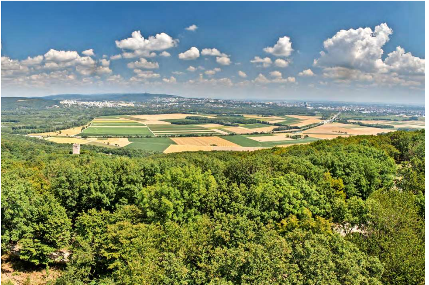
Blick von der Königswarte über die Ruine Pottenburg und Felder in den Gemeinden Wolfsthal und Berg. Im Hintergrund die Stadtteile Bratislava-Karlova Ves, Bratislava-Altstadt und Bratislava-Petržalka.